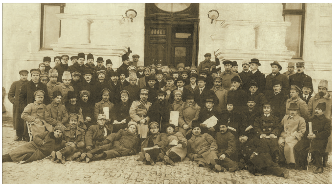
Sfatul Țării, anul 1918.

În mesajul acad. Gheorghe Duca , președintele Academiei de Științe a Moldovei, prezentat de către acad. Ion Tighineanu , au fost evocate figurile emblematice și evenimentele relevante pentru românii de la Est de Prut, din toamna anului 1917 și primăvara anului 1918, inclusiv momentul edificator al ședinței din 27 martie 1918, în care Sfatul Țării a votat Unirea